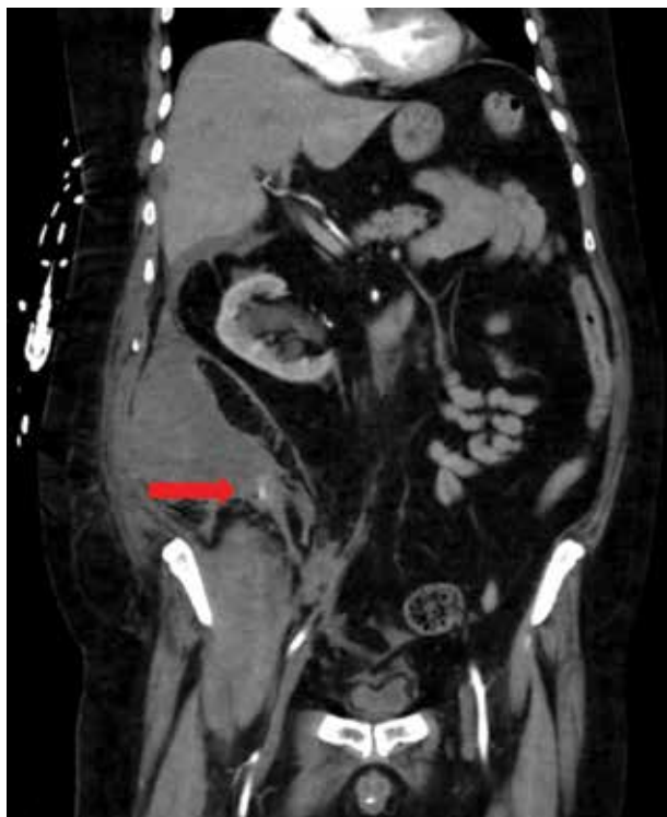
Obr. 1: CT frontální řez: hematoma retroperitonea vpravo s viditelným krvácením v mediokaudální porci (označeno šipkou)

LMWH jsou považovány za bezpečné a efektivní v profylaxi i léčbě akutního koronárního syndromu, non-Q infarktu myokardu, žilní trombózy a plicní