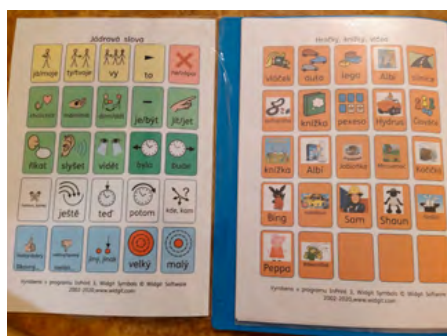
Obrázek 3: Zde je jádrová slovní zásoba na jedné vyklápěcí straně vcelku

Tabulky jádrové slovní zásoby pochopitelně nejsou něčím, co by bylo navždy neměnné. Naopak, každý logoped by měl umět si je podle potřeby a hlavně na základě používání se svými klienty upravovat a doplňovat. Důležité je také vědět, že jádrovou slovní zásobu se lze naučit a používat namísto symbolů v podobě manuálních znaků, což umožní rychlejší přístup ke komunikaci v mnoha situacích.