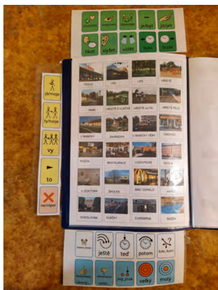
Obrázek 2: Knížka s vyklápěcí jádrovou slovní zásobou po stranách umožní snadný přístup ze všech stran s tematickou slovní zásobou

Tato tabulka může být umístěna v komunikační knize jako úvodní a připevněná v ní tak, aby se dala vyklápat pro použití s tabulkami slov tematické slovní zásoby. Dá se ale i rozdělit na jednotlivé vyklápěcí „ušičky“, což umožní lepší přístup z jednotlivých stránek tematické slovní zásoby (viz obrázky níže). Lze ji zpracovat i formou flipbooku, nástěnky, nebo třeba komunikační zástěry, na níž jsou připevněny symboly jádrové slovní zásoby. Na následujících obrázcích (obrázky 2 a 3) můžeme vidět příklady toho, že jádrová slovní zásoba skutečně umožní komplexnější komunikaci o tématu míst (já jsem byl..., viděl jsem..., bylo to hezké..., chci ještě...) i o tématu oblíbených hraček, pohádek apod. (mám..., chci/nechci..., líbí se mi..., malý..., ještě chci..., nemám rád..., viděl jsem...), než kdybychom používali pouze samotné tabulky z fotek míst či hraček. Zároveň je zde i dobře vidět, že jádrová slovní zásoba pro dvě rozdílná témata je skutečně obdobná.