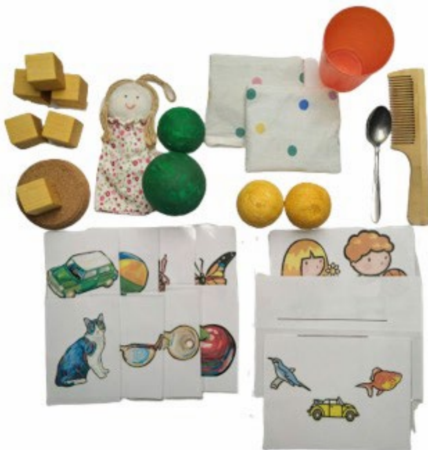
Obrázok 1: Materiál na vyšetrenie porozumenia v rámci Funkčnej vývinovej diagnostiky