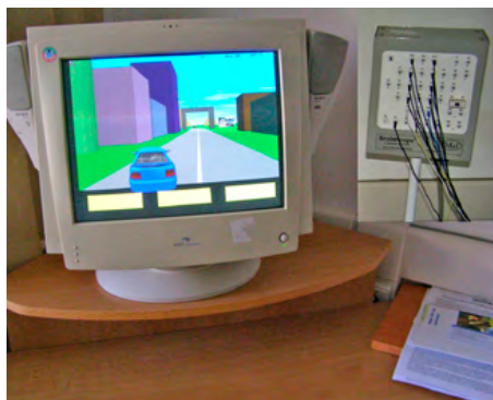
Obrázek 3: EEG biofeedback

( Tangramy, Loplíner ), propriocepci a rovnováhu s pomocí balančních pomůcek (např. pedoball, šlapadlo, nestabilní plocha, točna, lavor ), popř. knoflíku na niti, joja .