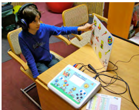
Obrázek 1: Pilot Hearing Test – screening sluchu

Od zřejmě primárně fyziologického (?) stavu docházelo postupně ke ztrátám v oblasti vysokých tónů. Po orientačním vyšetření specialistou 9 byl zjištěn pokles ve frekvenční oblasti nad 4 000 Hz (ve 3,5 letech).