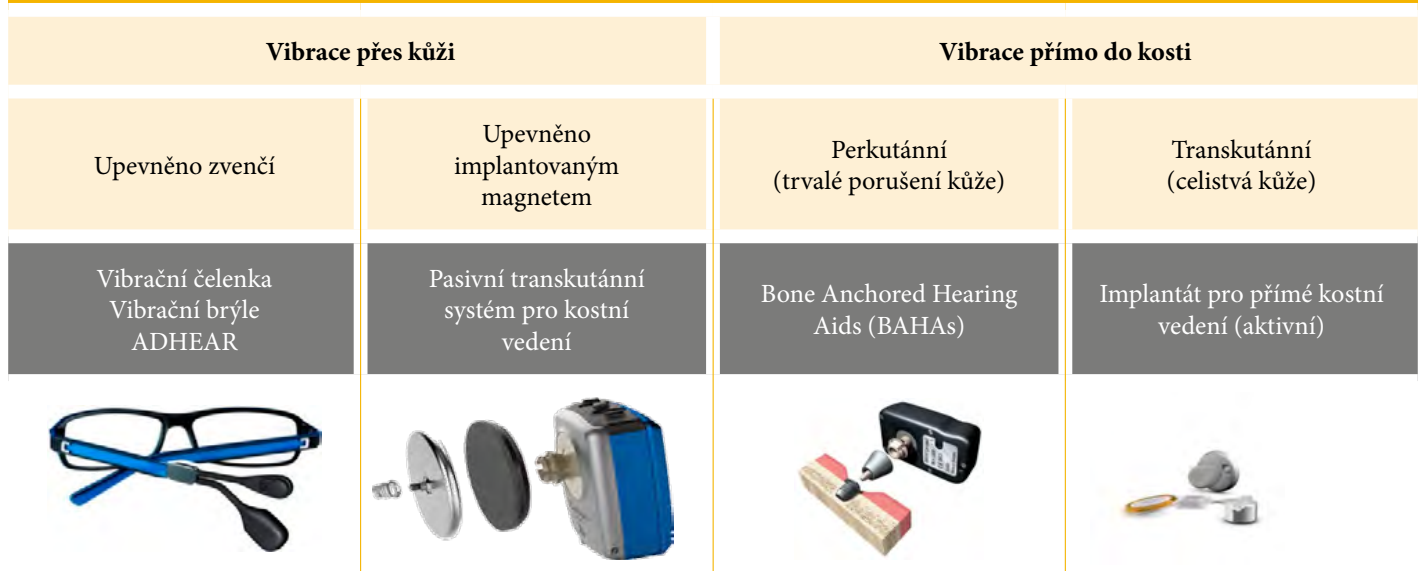
Tabulka 1: Zařízení pro kostní vedení zvuku

Historicky byla jako první používána zařízení, u kterých se vibrace šíří přes kůži. Dodnes se používají především u nejmenších dětí. Tyto vibrační pomůcky mají však mnoho nevýhod. Princip fungování je založen na tlaku vibrátoru na lebku, většinou pomocí čelenky (obrázek 1). To způsobuje časté otlaky, zarudnutí a bolestivost v místě vibrátoru, výjimkou nejsou ani opakované bolesti hlavy (Verhagen, 2008). Nezanedbatelný je i komfort nošení a estetický dojem, který není pacienty vnímán pozitivně. Především nejmenší děti, u kterých se používají vibrátory na čelence, odmítají tato zařízení nosit. Jednou z nejnovějších alternativ k vibračním čelenkám je ADHEAR, výrobek rakouské společnosti MedEl (obrázek 2). Sestává z adaptéru, jenž se nalepí za ucho do oblasti bradavčitého výběžku, a vlastního procesoru, který se následně připevní na adaptér (obrázek 3 a 4). Procesor zachytává zvukové informace z okolí, transformuje je na vibrace, které se pak přenáší na lebeční kost. Největší výhodou je fakt, že ADHEAR je „pressure free“, znamená to, že přenos vibrační není závislý na tlaku vibrátoru na kůži. Odpadají tak tradiční výše popsané komplikace. Navíc je zde i benefit z estetického hlediska. ADHEAR je vhodnou variantou k rehabilitaci sluchu jak u dětí, tak u dospělých, což dokazuje již několik studií (Urík, 2019, Dahm, 2018, Neumann, 2019).