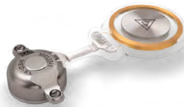
Obrázek 5: Bonebridge – aktivní transkutánní implantát pro kostní vedení, vnitřní část