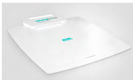
Obrázek 2: Příklad plantografické plošiny ( www.physiosensing.net ; 2018)

Pro terapii poruch rovnováhy je často využívána stabilometrická nebo plantografická plošina (obr. 2), pomocí níž lze sledovat polohu kolmého průmětu těžiště pacienta na plošinu nebo i detailnější rozložení tlaku pod chodidlo (Corbetta, D. et al.; 2015). Je možné detekovat a terapeuticky ovlivnit například snížený rozsah pohybu těžiště do všech směrů nebo stranovou asymetrii stoje.