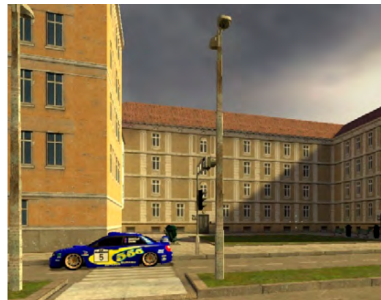
Obrázek 3: Virtuální terapeutická scéna přechod přes silnici (Tichá, M. et al.; 2014)

V průběhu terapie je možné simulovat problémové situace zaměřené na aktivity běžného života, například nakupování nebo přechod přes rušnou silnici (obr. 3). Pro nácvik řízení motorových vozidel mohou být využívány trenážery s volantem a pedály.