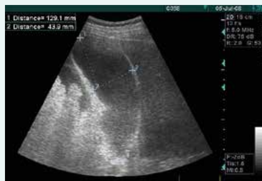
Obr. 5. Hydripický žlučník u akutní pankreatitidy těsně před zavedením pig tail katétru přes okraj pravého jaterní laloku

Samotné vyšetření střevních klíčků umožňuje vidět jejich tekutý obsah (při plynném není vyšetření střeva možné), peristaltiku a tloušťku střevní stěny. Pokud není střevo zaplynováno, je možné diagnostikovat ileus nebo třeba megakolon. Vyšetření sleziny umožňuje s určitou přesností monitorovat např. trauma nebo splenické infarkty. Játra jsou rutinní součástí USG vyšetření břicha, při pátrání po zdroji sepse často vyšetřujeme žlučník a žlučový strom. Akutní cholecystitida je diagnostikována při stěně žlučníku > 4 mm (v závislosti na enterálním příjmu), žlučníku distendovaném > 5 cm, pericholecystickém infiltrátu/tekutině a sludge/kamenech u kalkulózního zánětu [37]. Žlučník se někdy vyklenuje z pod jaterního laloku a lze ho punktovat pod kontrolou USG jak transperitoneálně, tak i transhepaticky [38] (obr. 5). Výhody transhepa-