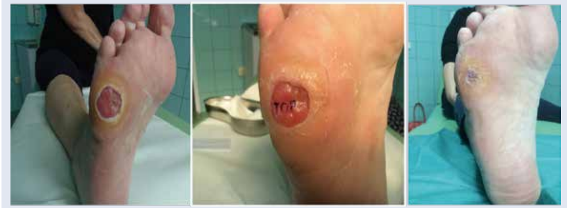
Obr. 3 | Instilácia Heberprotu-P do spodiny a okrajov dlhodobo sa nehojacej neuropatickej ulcerácie