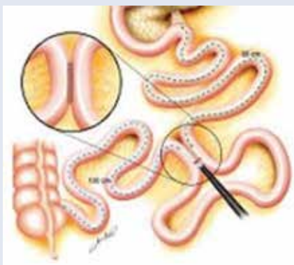
Obr. 4 | Parciálna jejunálna diverzia pomocou magnetických osemhranov. A – príprava k naloženiu magnetov B – endoskopický pohľad na jejúnoileálnu anastomózu. Upravené podľa [19]