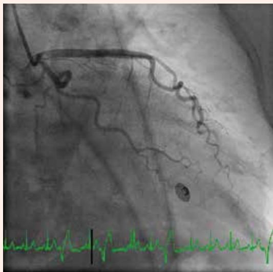
Obr. 3. Pacientka s koronárnym syndrómom X, pokračovanie pomalého odtoku kontrastnej látky z RIA.