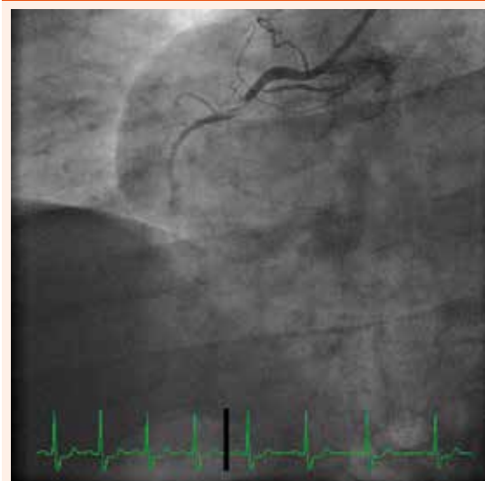
Obr. 5. Hemodynamicky významná tandemová stenóza RIA.