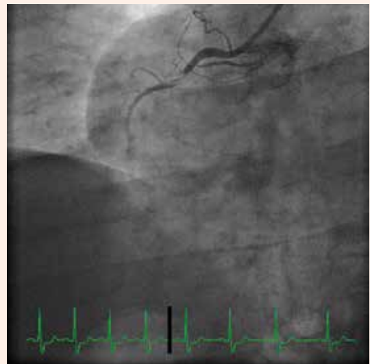
Obr. 5. Hemodynamicky významná tandemová stenóza RIA.