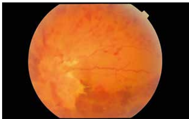
Obr. 4. Očné pozadie

Patológia toxoplazmózy je najlepšie definovaná okrem kongenitálne infikovaných detí aj u imunosu-