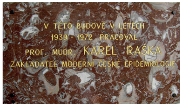
Pamětní deska v budově 2 SZÚ, odhalená v r. 1995 u příležitosti oslav 70. výročí založení SZÚ

V roce 2009 bylo připomenuto 100 let od narození prof. Rašky sympoziem „Surveillance a budoucnost epidemiologie“, které organizovaly 1. LF UK, SEM ČLS JEP ve spolupráci se SZÚ a 3. LF UK v Praze. V roce 2010, kdy svět vzpomínal 30. výročí vymýcení neštovic, uspořádala pražská kancelář WHO odbornou konferenci, výstavu „Smrt neštovic“ a tiskovou konferenci. Ve stejném roce byla na rodném domě prof. Rašky ve Strašíně ve spolupráci SEM ČLS JEP, kanceláře WHO v ČR, Ministerstva zdravotnictví a obce Strašín, odhalena pamětní deska. V letech 2008–2019 udělila SEM ČLS JEP Cenu profesora Karly Rašky svým členům za nejlepší odbornou publikaci v předchozím roce. V roce 2017 byl 6. Kongres klinické mikrobiologie, infekčních nemocí