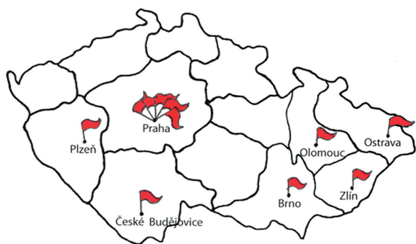
Obr. 1. Mikrobiologická pracoviště, která poskytla data do studie – rozložení v ČR

Získané izoláty kvasinek byly zařazeny do rodu a druhu proteomickou metodou MALDI-TOF MS (Matrix Assisted Laser Desorption Ionization – Time of Flight-Mass Spectroscopy – MALDI Biotyper, Bruker, Německo; Axima Performance, Shimadzu, Japonsko) nebo automatickým identifikačním systémem VITEK®2 (BioMérieux, Francie) nebo pomocí biochemických (ID 32C, API 20C AUX (BioMérieux, Francie), Auxacolor2 (BioRad, Francie) a mikro-morfologických (rýžový agar, cornmeal agar) testů.