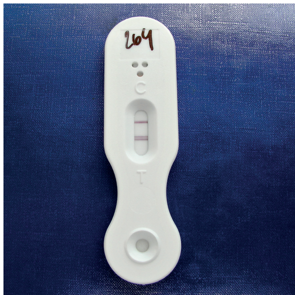
Obr. 4. Lateral flow device – demonstrace pozitivního výsledku

celkem 220 sér a 430 BAT. Senzitivita a specifická v BAT byla 86% a 93%, v séru 68% a 87%, nejvyšší byla u pacientů s hematologickými malignitami, nižší u pacientů s onemocněním plic [42]. Metoda má srovnatelnou specifickou i senzitivitu s GM ELISA i PCR. White et al. demonstrovali na souboru 103 hematologických pacientů ve