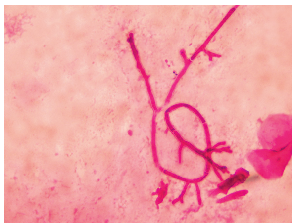
Obr. 2. Aspergilová vlákna v bronchoalveolární tekutině, barvení podle Grama

Mikroskopicky lze vyšetřovat nativní vzorky optickým mikroskopem po přidání 20% KOH, dále preparáty barvené běžnými mikrobiologickými postupy (Gram, Giemsa, Gram-Weigert) nebo fluorescenčním mikroskopem po obarvení fluorochromy. Rod Aspergillus má septované hyfy 3–12 µm široké, větví se do tvaru písmene V (dichotomické větvení, úhel pod 45 stupni, obr. 2). Metoda je rychlá, levná, nevýhodou je nízká senzitivita [9].