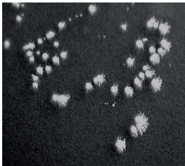
Obr. 1. Vzhled kolonií C. dubliniensis na Staibově agaru Fig 1. The appearance of C. dubliniensis colonies on Staib medium

testované kvasinky na Sabouraudově agaru byly 1–2 kolonie resuspendovány v 75 \mu l sterilní vody a zahřáty na 95 °C (10 min.). Po centrifugování (14 000 g/7 min.) bylo odebráno 50 \mu l supernatantu obsahující DNA. Pro PCR byly použity dva páry primerů – univerzální a druhově specifické [20]. Reakční směs o celkovém objemu 25 \mu l obsahovala 12,5 \mu l master mix (PPP Master Mix, Top-Bio, s.r.o.), 100 mM každého primeru, a 1 \mu l templátové DNA. Podmínky reakce byly následující: úvodní denaturace (95 °C/5 min.), 30 cyklů denaturace (95 °C/1 min.), připojení primerů (59 °C/30 s) a prodlužování řetězce (72 °C/30 s), konečná prodlužovací fáze při 72 °C po dobu 10 min. (Termocycler PTC-200, MJ Research, USA). Produkty reakce byly detekovány agarózovou gelovou elektroforézou a vizualizovány UV transiluminátorem (UVT-20 M, Herolab GmbH Laborgeräte, Německo). U C. albicans byla výsledkem PCR přítomnost jednoho pruhu (614 bp), zatímco izoláty C. dubliniensis tvořily dva produkty (614 bp a 288 bp) (obr. 2).