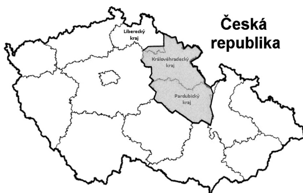
Obr. 1. Mapa nově konstituovaného Královéhradeckého kraje (od roku 2001)

Data hlášených případů syfilis i další charakteristiky byly shromážděny v rámci povinného hlášení případů syfilis a zjišťování zdrojů a kontaktů těchto jedinců prováděných v každém kraji a tvořící nedílnou součást směrnic doporučených Českou dermatovenerologickou společností. Data jsou pro svou citlivost anonymní a jsou dostupná čtyřem kategoriím zdravotnických pracovníků – ošetřujícím lékařům, střednímu zdravotnímu personálu, sestrám specializovaným v depistážní službě a pověřeným lékařům státního dozoru. Demografické charakteristiky sledovaného regionu jsou následující: Východočeský kraj byl do roku 2000 tvořen 11 okresy s celkovým počtem 1 231 459 obyvatel, z tohoto počtu bylo 631 000 žen (51%) – 308 000 žen ve věkové kategorii 15–49 let. Po redistribuci krajů v roce 2001 zahrnoval nově vytvořený Královéhradecký kraj (obr. 1) zhruba polovinu původního kraje s 554 000 obyvateli v 5 okresech. Podíl žen v nově konstituovaném kraji byl shodný (51%).