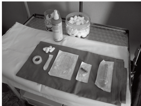
Obr. 1 Jednoduché instrumentarium pro SCIG Fig. 1 A simple SCIG administration device

Jednoduché instrumentarium (obr. 1, 2) a způsob aplikace (obr. 3, 4, 5 a 6) umožňuje po patřičném zaškolení pacienta a dobrém rodinném (sociálním) zázemí zejména u SCIG terapie bezpečnou domácí léčbu. Může zvýšit kvalitu života nemocného. Při domácí léčbě pacient nesmí být nikdy sám, aby byla garantována dostupná účinná pomoc v případě výskytu jakýchkoli komplikací.