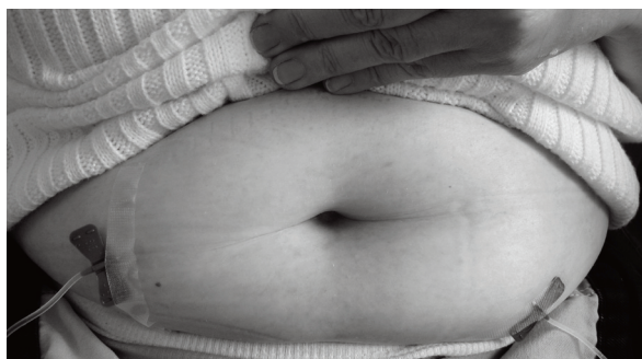
Obr. 5 Současné dvě subkutánní infuze (2 pumpy nebo 1 pumpa s kanylovou „Y“ rozdvojkou, viz obr. 6) u dospělého pacienta. Vzhledem k celkové dávce se sníží doba podání na polovinu. Fig. 5 Two concomitant subcutaneous infusions (2 pumps or 1 pump with a Y tube, see Fig. 6) in an adult patient. With two doses given at the same time, the administration time is halved.