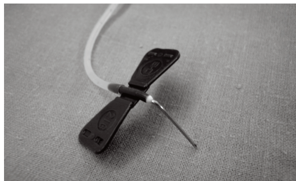
Obr. 3 Úprava kanyly pro kolmý vpich Fig. 3 Adjusting the tube to insert the needle perpendicular to the skin