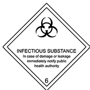
Obr. 1. Značka infekční substance kategorie A

Fig. 1. Hazard label for Category A infectious substances