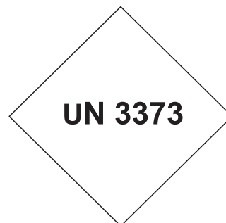
Obr. 2. Značka UN 3373 pro označení kategorie B

Fig. 1. Hazard label for Category A infectious substances