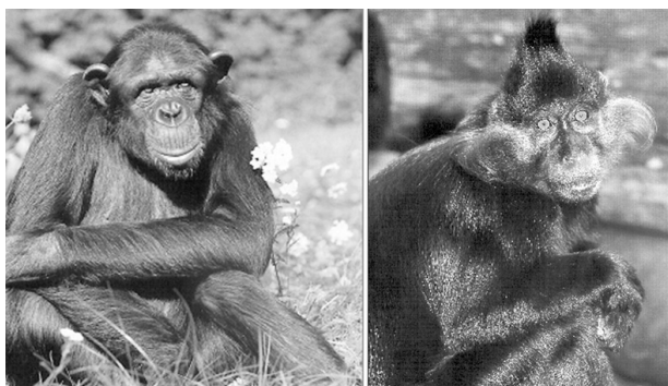
Obr. 5. Bezpříznakoví nosiči HIV u opic ze Subsaharské Afriky – HIV-1: Šimpanz učenlivý (respektive poddruh Pan troglodytes troglodytes ), HIV-2: Mangabey černý ( Cercocebus atherrimus )

Fig. 5. Asymptomatic HIV carriers, non-human primates from sub-Saharan Africa HIV-1: Central common chimpanzee ( Pan troglodytes troglodytes ) HIV-2: Black mangabey ( Cercocebus atherrimus )