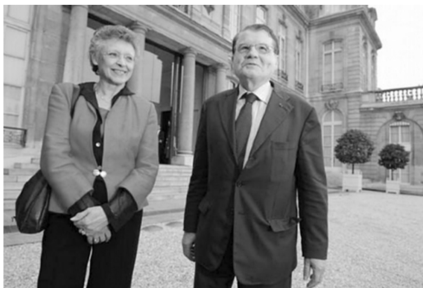
Obr. 2. Nositelé Nobelovy ceny za medicínu 2008 – Françoise Barré-Sinoussi (1947) a Luc Montagnier (1932)