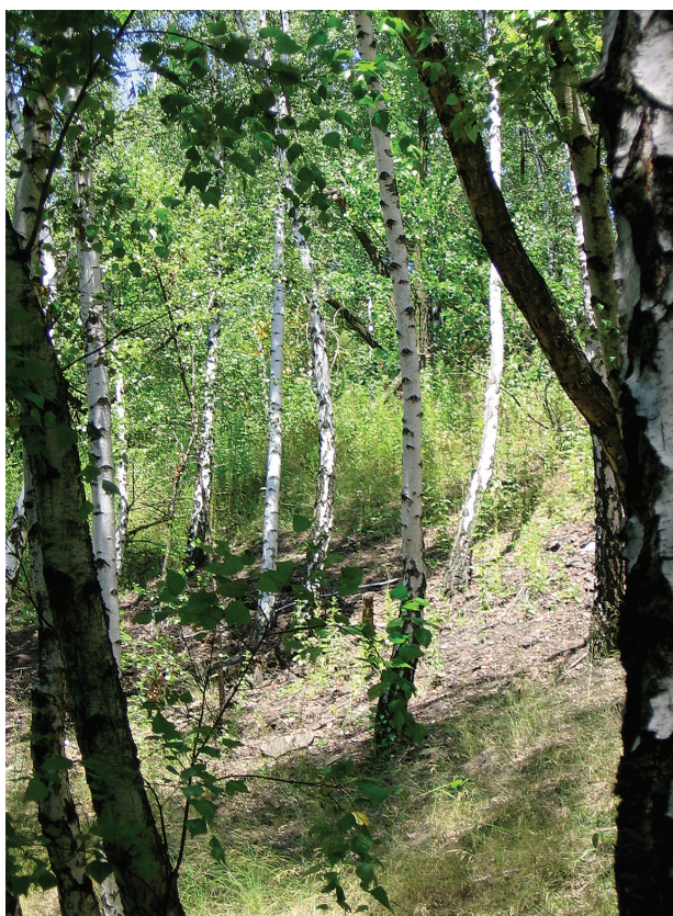
Obr. 3. Halda B („Emma“), svahy