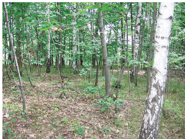
Obr. 2. Halda A („Oskar“)

Fig. 1. Map of the Ostrava area ( http://supermapy.centrum.cz ) with three encircled tick collection sites (from North to South: Hlučín, control site C, slag heap Oskar, site A, and slag heap Emma, site B)