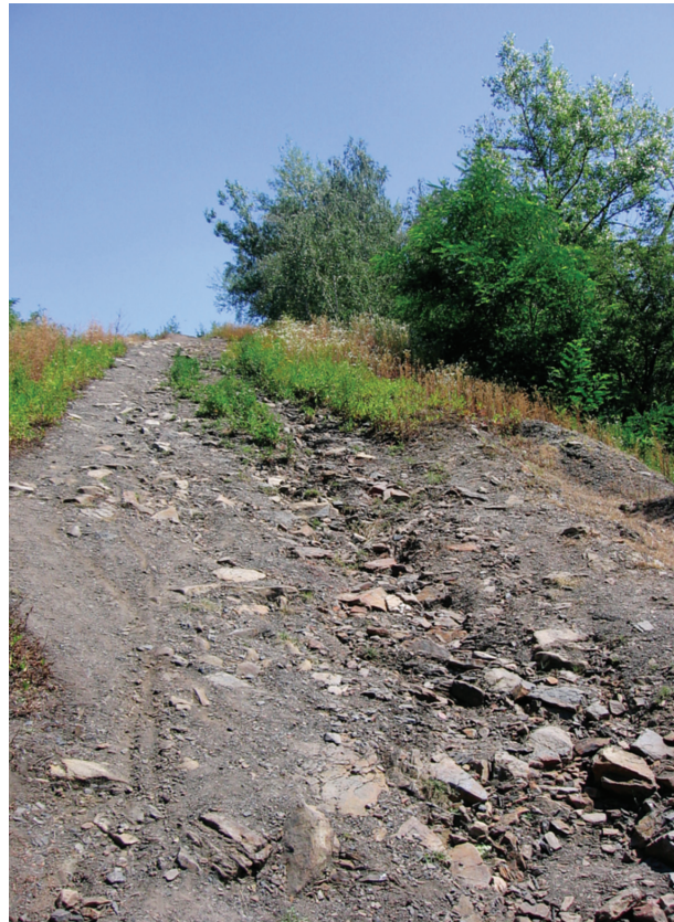
Obr. 4. Halda B („Emma“), horní partie

Fig. 4. Site B (slag heap Emma), upper part