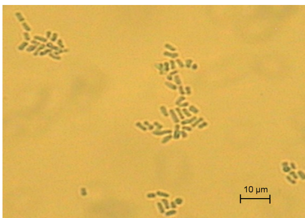
Obr. 2. a, b A. kalrae , artrokonídiá, fuziformné a guľovité konídiá (Sabouraudov agar, vláknitá forma, 25 °C, preparát v laktófenole)