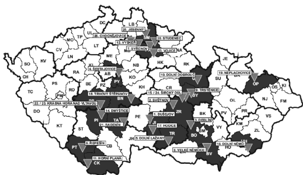
Obr. 2. Pozitivní nálezy BSE v České republice k 5. 12. 2006 zdroj: Státní veterinární správa České republiky (www.svscrcz)