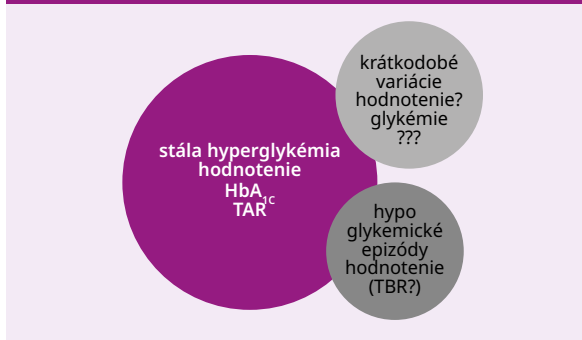
Schéma 2 | Vzájomná prepojenosť jednotlivých súčastí dysglykémie pri diabetes mellitus

TAR – hladina glukózy v krvi nad pásmom dobrej kompenzácie/Time Above Range TBR – hladina glukózy v krvi pod pásmom dobrej kompenzácie (v hypoglykemickom pásme)/Time Below Range