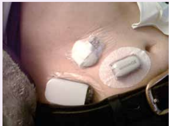
Obr. 1 | Rôzne typy senzorov s externou časťou senzora na povrchu tela.

Súčasne na základe matematického modelovania sa zobrazujú trendové šípky vzostupu, resp. poklesu glykémii. Softwary poskytujú možnosť prednastaviť hodnotu glykémie, pri ktorej pacienta upozorní zvukový alebo vibračný alarm na hroziacu hypoglykémiu (prediktívny alarm) a v prípade inzulínovej pumpy spojenej so sensorom (SAP) dokážu na prechodnú dobu zastaviť dávkovanie inzulínu a zabrániť vzniku hypoglykémie (obr. 2). Alarmy môžu byť nastavené aj na aktuálnu hodnotu glykémie, ktorú si navolíme ako hodnotu pre hypo/resp. hyperglykémie. Systémy na monitorovanie glykémie v reálnom čase sú ako samostatné glykemické holtre Dexcom G4 a G5, Guardian Connect