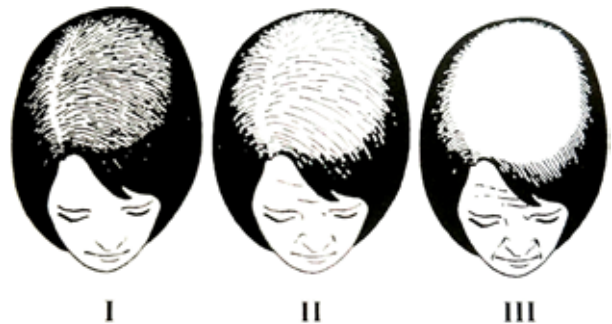
Obr. 2. Ludwigova klasifikace tíže FAGA [11]