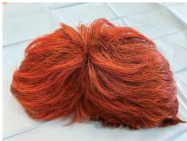
Obr. 5. Paruka – zevní strana

Paruky z pravých vlasů jsou na pohled i dotek nerozpoznatelné od vlastních vlasů a jejich životnost je ve srovnání se syntetickými parukami delší. Výhodou paruk z pravých vlasů je široká variabilita střihů a tvarů. Vlasy je možné tvarovat do různých účesů, kulmovat, foukat i upravovat barevný odstín. Tvar účesu je ale nutné obnovovat stejně často jako u vlastních vlasů. Příčesek se používá na normálních vlasových porostech ke zlepšení nebo vytvoření bohatší formy účesu. Velikost a tvar příčesků se řídí účelem, který má splnit. Tupé je pak pomůckou, která zakrývá částečnou nebo úplnou ztrátu vlasů na temeni hlavy (na rozdíl od paruky, která pokrývá celou hlavu). Samotné vlasy u pří-