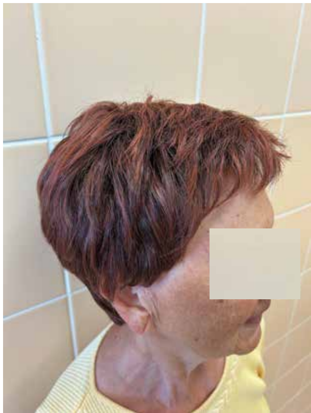
Obr. 4. Pacientka s FAGA v paruce

Někteří pacienti trpící AGA (zejména ženy) nadále využívají protetické pomůcky – paruky, příčesky a tupé. Jedná se o kamuflážní techniky „léčby“ AGA, na které pacienti spolupracují se zručným odborníkem ve vlásenkářství. Paruka je umělá pokrývka hlavy, skládající se z pletené sítě protkané přírodními nebo syntetickými vlákny . Paruky jsou rozdílné pro ženy a muže a dělíme je na účelové a módní. Účelové jsou