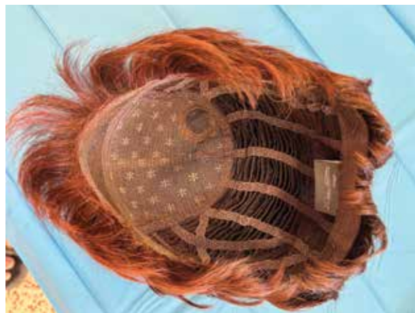
Obr. 6. Paruka – vnitřní strana s monturou