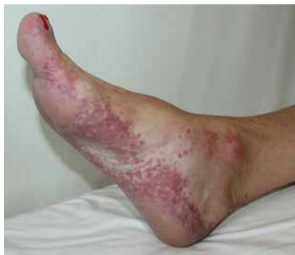
Obr. 3. Livedo racemosa plosky u pacientky s mnohočetným myelomem a kryoglobulinou I. typu

Rozlišujeme tři typy bílkovin, které jsou schopny chladové precipitace. Kryoglobuliny jsou imunoglobuliny, které jsou přítomny jak v séru, tak v plazmě a reverzibilně precipitují působením chladu. Kryofibrinogeny jsou fibrinogeny, které se srážejí v chladu, jsou spotřebovávány při koagulaci, a proto jsou detekovatelné pouze ve vzorcích plazmy. Chladové aglutininy (kryoaglutininy) jsou protilátky, které podporují aglutinaci červených krvinek při vystavení chladu. Všechny tři skupiny těchto bílkovin mohou způsobit okluzivní syndromy v kůži, které jsou spuštěny vystavením chladu [25]. Zatímco kryofibrinogeny a chladové aglutininy mohou být detekovány u mnoha pacientů v souvislosti s řadou onemocnění, jsou zřídka příčinou okluzivních syndromů souvisejících s vystavením chladu. Klinické syndromy způsobené přímo kryoprecipitací nebo kryoaglutinací nejsou časté. Kryoglobuliny mění svou konfiguraci v chladu a stávají se ve vodě nerozpustnými, což zvyšuje viskozitu krve a usnadňuje cévní okluzi. Kryoglobuliny