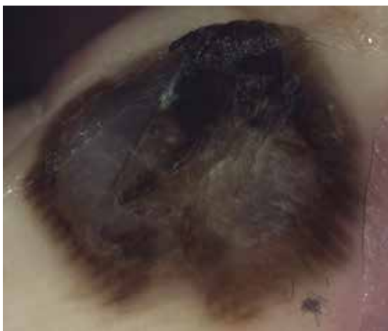
Obr. 7. Maligní melanom 1,1 mm s regresí Projev je větší než 1 cm v průměru, v centru bezstrukturální okrsky s difúzní šedomodrou nebo bělavou pigmentací, při okrajích široká lineární pigmentace nad cristae superficiales.

neum) pod mechanickým vlivem. Fibrilární pigmentace (především pravidelná) odpovídá ve většině případů melanocytovému névu, nevyklučuje ale v ojedinělých případech (nepravidelné uspořádání) tenký maligní melanom (většinou melanoma in situ).