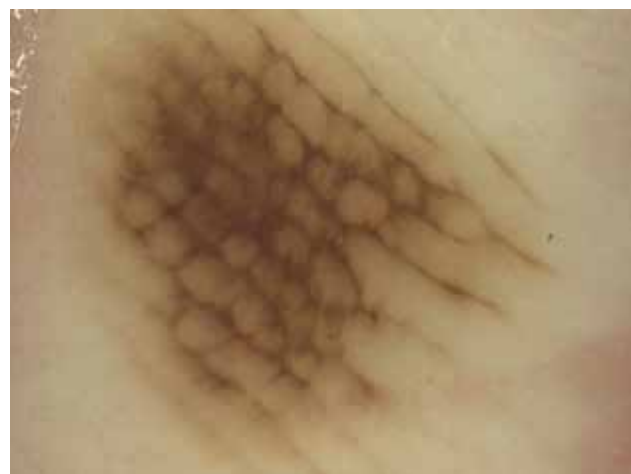
Obr. 4. Melanocytový névus „Lattice like pattern“ – lineární pigmentace ve žlábcích pospojovaná napříč do obrazu mříže.

Především melanocytové névy mohou mít schematicky celou řadu variant. Může jít o typ mřížkovitý („lattice like pattern“), fibrilární, homogenní, globulární, retikulární, atypický a řadu dalších [2, 3]. Typ mřížkovitý (obr. 4) je tvořen tenkými hnědými liniemi v sulci superficiales, které jsou na rozdíl od nejčastější varianty navíc navzájem pospojovány kratšími liniemi probíhajícími napříč. Dermatoskopický obraz tak připomíná mříž. Mřížkovitý typ je druhým nejčastějším nálezem u získaných melanocytových nevů, v praxi se s ním setkáváme velmi často a je ukazatelem nezhoubného charakteru akrální melanocytové léze. Typ fibrilární (obr. 5) je tvořen velmi tenkými hnědými liniemi, které probíhají paralelně šikmo jak přes sulci superficiales, tak i přes cristae superficiales [2, 3]. Setkáváme se s ním při vyšetření melanocytových projevů na chodidlech v místech největší mechanické zátěže, kam je přenášena většina tělesné hmotnosti – tedy nejčastěji na patách a při zevním okraji chodidla. Ke vzniku tohoto vzorce pigmentace dochází díky posunu nejsvrchnějších vrstev epidermis (sešikmení stratum cor-