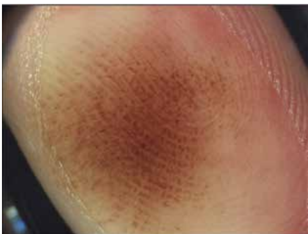
Obr. 8. Intrakorneální hemoragie Parallel-ridge like pattern – rezavě hnědá široká lineární pigmentace nad crista superficialis. Vzniká po chronické traumatizaci.

Závěrem je možné konstatovat, že dermatoskopické vyšetření hraje u plochých pigmentovaných projevů