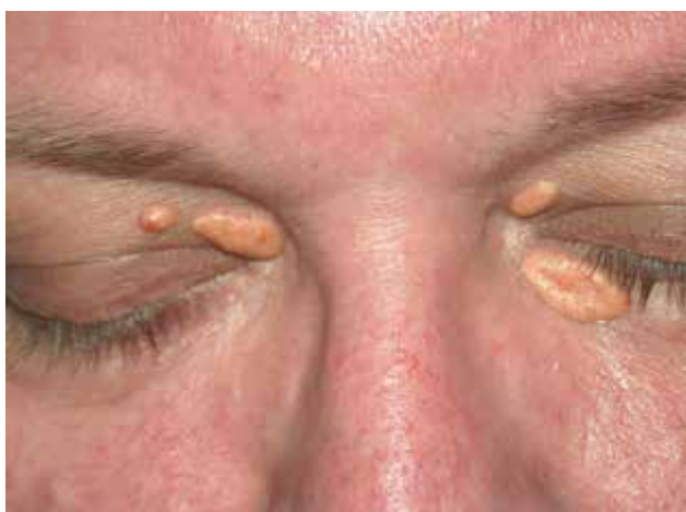
Obr. 6. Xanthelasma palpebrarum

šlachových xantomů je nodulární či fusiformní; nad klouby mohou mít tuhou konzistenci (obr. 5). Pokud se diagnostikují v oblasti Achillovy šlachy před rozvojem hrbolu, lze zjistit šlachové ztlustění, případně změnu šlachové textury, které je možno kvantifikovat zobrazovacími metodami). Nález XT je příznačný pro dyslipidemie uvedené u tuberózních xantomů s výjimkou familiární dys- \beta -lipoproteinemie (hyperlipoproteinemie III. typu).