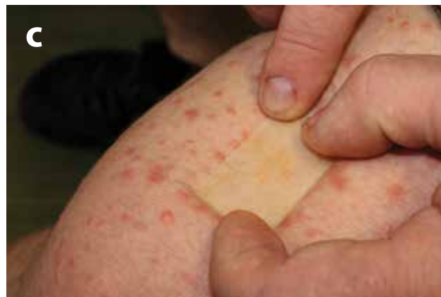
Obr. 3 a, b, c. Xanthoma eruptivum Výsev papul (a, b) žlutavě prosvítajících při vitropresí (c).