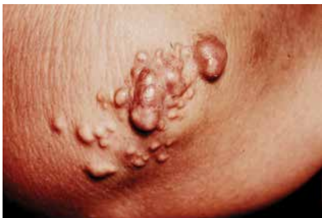
Obr. 4. Xanthoma tuberolum

Xanthoma tendineum – šlachové xantomy (XT) difuzně infiltrují šlachy, ligamenta a fascie. Jsou uloženy subkutánně a kryty normální kůží. Předilekční lokalizaci představuje Achillova šlacha a šlachy extenzorů prstů rukou, kolen a loktů. Často jsou uloženy subperiostálně v oblasti tuberositas tibiae (úpon patelární šlachy). Tvar