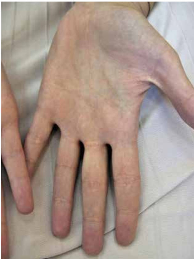
Obr. 9. Xanthoma striatum palmare u 30leté nemocné s ulcerózní kolitidou a primární sklerotizující cholangitidou

Xanthoma intertriginosum – jde o žlutavá ložiska infiltrující intertriginózní prostory s lokalizací v axilách, meziprstí, ohybech loktů a kolen (obr. 9). Byly popsány u autozomálně dominantní FH na podkladě mutace LDLR , dále se mohou vyskytovat u sekundární dyslipidemie podmíněné přítomností Lp-X (nejčastěji u chronického cholestatického syndromu) [53, 61, 67].