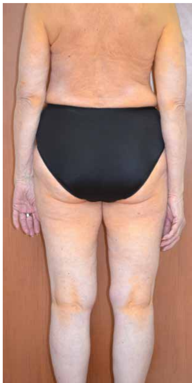
Obr. 8. Xanthoma diffusum planum et intertriginosum u nemocné s monoklonální gamapatií IgG kappa a asymptomatickým mnohočetným myelomem IgG bez orgánového postižení

polovině těla, s postižením obličeje, axil, krku, ramen a vzácně hýždí (obr. 8). Zpravidla nebývají spojena s dyslipidemií. Jejich nález nutí pomýšlet na přítomnost monoklonální gamapatie (mnohočetný myelom, monoklonální gamapatie neurčeného významu, MGUS), či na přítomnost nádorového lymfoproliferativního onemocnění (non-Hodgkinův lymfom, chronickou lymfocytární leukemii, chronickou myeloidní leukemii, myelodysplastický syndrom) [80]. Difuzní ploché xantomy mohou být asociovány s onkohematologickými malignitami, jako je Mycosis fungoides (epidermoidní kožní T lymfom) nebo Sézaryho syndromem (leukemická forma Mycosis fungoides , současně s výskytem