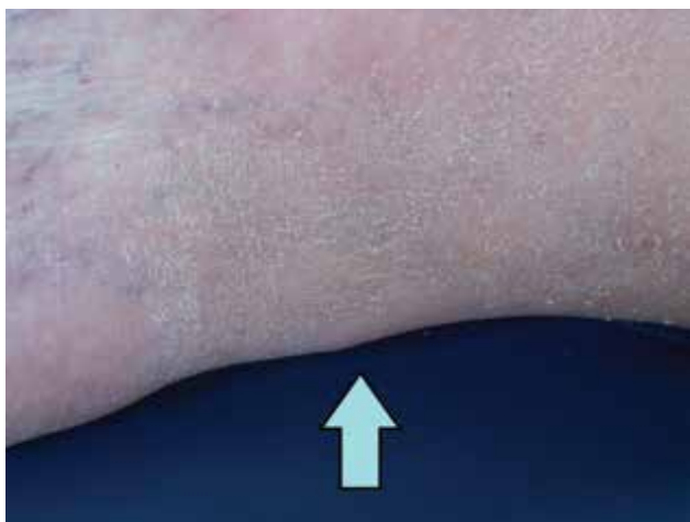
Obr. 5. Xanthoma tendineum (Achillovy šlachy)