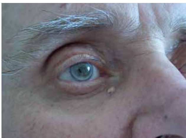
Obr. 7. Arcus lipoides cornae (gerontoxon) a xanthelasma palpebrarum

Xanthoma diffusum planum – jde o vzácný typ xantomu, který se prezentuje jako plochá difuzní žluto-oranžová ložiska, nejčastěji lokalizovaná na horní