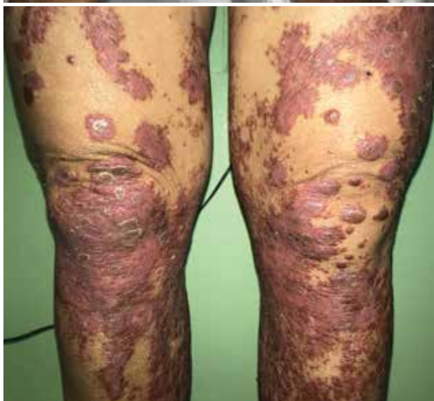
Obr. 1. Lokální nález při přijetí a) hyperkeratózy v oblasti plosek, b) exantém na rukou s postižením nehtů, c) lividní papulózní léze s deskvamací v oblasti dolních končetin

cerace s výrazným foetorem. Nehtové ploténky prstů nohou byly z větší části odloučené, na trupu a končetinách byly přítomny erytematoskvamózní papuly splývající do ložisek až ploch, místy vykazující Koebnerův fenomén (obr. 1a, b, c). Laboratorně byla v krevním obraze mírná neutrofilie bez leukocytózy. Základní biochemický screening byl bez větších patologií, pouze CRP po dobu hospitalizace kolísalo v rozmezí hodnot 40–118 mg/l (norma do 5 mg/l). Výše hodnoty tohoto markeru nebyla závislá na léčbě kortikosteroidy. Jednalo se o paraneoplastický projev při základním nádorovém onemocnění.