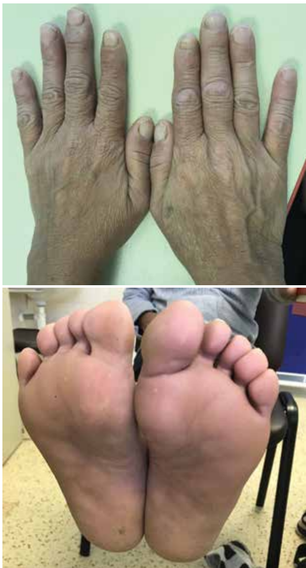
Obr. 3. a, b. Stav po vysazení nivolumabu a ukončení léčby exantému

Parenterálně byl podáván methylprednisolon v dávce 62,5 mg/den po dobu 5 dnů s následným přechodem na prednison per os v dávce 40 mg/den s postupným snižováním v průběhu 10 dnů. Lokální terapie byla zahájena odstraněním hyperkeratóz, na plošky byla lokálně aplikována antiseptika, keratolytika a 5% ichtamol v 3% borové vazelině, na projevy na kůži trupu a dolních končetin pak byl aplikován 0,02% betamethason ve vazelině. Po zlepšení celkového stavu i kožních projevů byla pacientka po 10 dnech propuštěna s nastavenou nízkou dávkou prednisonu 10 mg/den. Při ambulantní kontrole po 14 dnech, kdy trvala výrazná regrese kožního nálezu, byla terapie systémovými kortikosteroidy ukončena. Již týden po kontrole však došlo ke zhoršení hyperkeratotických projevů v oblasti dlaní a plosek. Pro recidivu projevů a suspektní rebound fenomén po vysazení systémových kortikosteroidů byla pacientka opět hospitalizována. Terapie lokální i systémová probíhala ve stejném schématu jako za předešlé