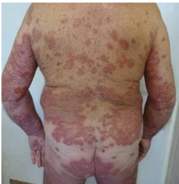
Obr. 6. Exacerbace dříve diagnostikovaného pemfigoidu po vakcinaci

Při této dávce nedocházelo k tvorbě puchýřů až do června 2021.