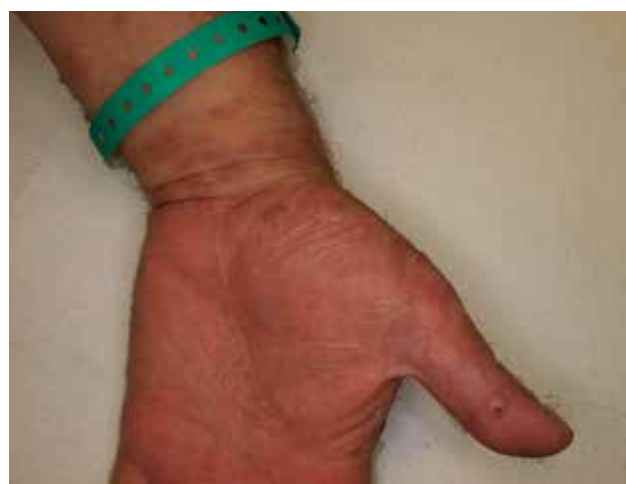
Obr. 1. Puchýře na dlaní u pacienta s bulózním pemfigoidem po očkování

Osobní anamnéza pacienta byla bez výraznějších pozoruhodností. Byl léčen pro arteriální hypertenzi,