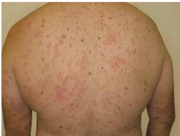
Obr. 2. Erytémová ložiska až urtikariálního vzhledu na trupu