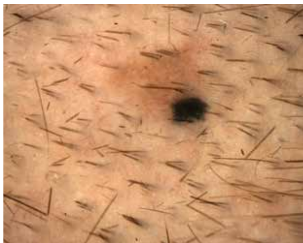
Obr. 1. Dermatoskopický obraz Světle hnědá symetrická léze s dlaždicím podobnými tmavšími okrsky a excentrickým šedočerným bezstrukturním ostrovem.

Pacientem je 38letý zdravý muž. Je dispenzarizován v dermatologické ambulanci po excizích dysplastických melanocytárních névů. V rodině se vyskytl povrchově