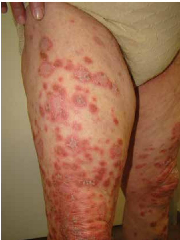
Obr. 1. Klinický nálezn na pravém stehně