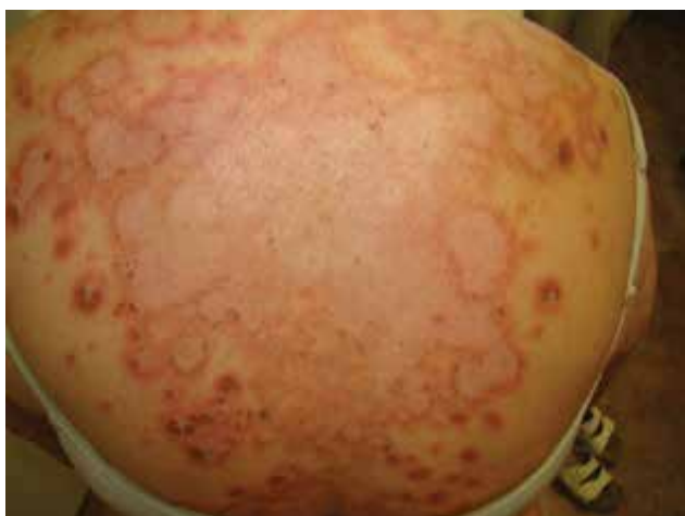
Obr. 2. Projevy SCLE v oblasti zad

Histologicky byla prokázána ložisková spongióza, četné nekrotické keratinocyty ve stratum spinosum a stratum basale, ložisková vakuolizace v zóně dermoepidermální junkce, lymfocytární exocytóza. V horní části koria byl perivaskulární lymfoidní infiltrát a edém, v dermis difúzně plazmocytoidně dendritické buňky (CD123 pozitivní) a depozita mucinu patrná v barvení koloidním železem. Imunofluorescenční vyšetření prokázalo pouze mírná depozita fibrinogenu v oblasti bazální membrány a pozitivní IgA struktury připomínající Civatteho tělíčka, zatímco IgM, IgG a C3 bylo negativní. Po provedení klinicko-patologické korelace nálezu byl histopatologický