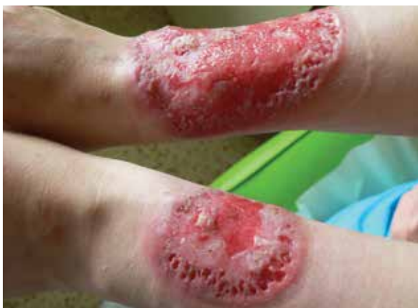
Obr. 2. Stav po 19 dnech hospitalizace

rací, kde podle závěru byla popisována akutní neutrofilní nekrotizující dermatóza s perivaskulární lymfoidní proliferací bez patrného aberantního fenotypu. V laboratorních výsledcích se zjistily pouze menší odchylky ve smyslu sideropenické anémie, mírná elevace zánětlivých parametrů, revmatologický screening (ASCA, ANA, ENA, RF, ANCA) vykázal pozitivitu u ANCA atypických protilátek (atypická perinukleární ANCA fluorescence s intranukleárním barvením -p-ANCA [22]), sérologie na lues byla negativní. V dalším průběhu byla doplněna imunofenotypizace z periferní krve i z kožní biopsie, která neprokázala hematologické malignity. Celková terapie kortikosteroidy byla konzultována s gynekologem – v úvodu jsme podali bolusy Solu-Medrolu 125 mg i. m. po 2 dny, s následným přechodem na p. o. formu kortikosteroidů (Prednison à 20 mg tbl.) v úvodní dávce 1 mg/kg/den. Lokálně jsme aplikovali obklady se superoxidovanými roztoky (Aqvitox®, Octenilin®) a zprvu antiseptické krytí (Bactigras®), následně krytí s obsahem oktenidinu a kyseliny hyaluronové (Sorelex®). Pro zlepšování klinického nálezu