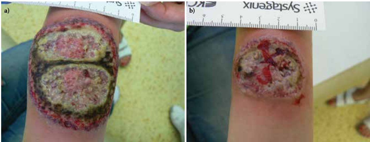
Obr. 1. Vředy při přijetí a – pravé předloktí, b – levé předloktí

rací, kde podle závěru byla popisována akutní neutrofilní nekrotizující dermatóza s perivaskulární lymfoidní proliferací bez patrného aberantního fenotypu. V laboratorních výsledcích se zjistily pouze menší odchylky ve smyslu sideropenické anémie, mírná elevace zánětlivých parametrů, revmatologický screening (ASCA, ANA, ENA, RF, ANCA) vykázal pozitivitu u ANCA atypických protilátek (atypická perinukleární ANCA fluorescence s intranukleárním barvením -p-ANCA [22]), sérologie na lues byla negativní. V dalším průběhu byla doplněna imunofenotypizace z periferní krve i z kožní biopsie, která neprokázala hematologické malignity. Celková terapie kortikosteroidy byla konzultována s gynekologem – v úvodu jsme podali bolusy Solu-Medrolu 125 mg i. m. po 2 dny, s následným přechodem na p. o. formu kortikosteroidů (Prednison à 20 mg tbl.) v úvodní dávce 1 mg/kg/den. Lokálně jsme aplikovali obklady se superoxidovanými roztoky (Aqvitox®, Octenilin®) a zprvu antiseptické krytí (Bactigras®), následně krytí s obsahem oktenidinu a kyseliny hyaluronové (Sorelex®). Pro zlepšování klinického nálezu