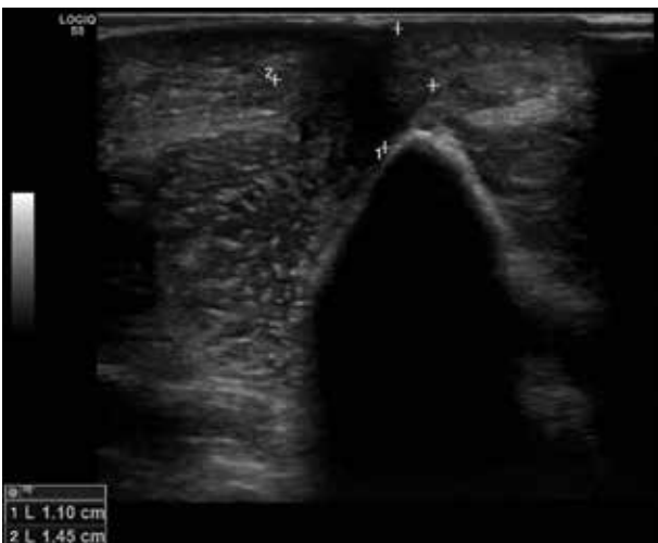
Obr. 5. Sonografický nález fibrózního uzlu v podkoží pravého loktu před léčbou antibiotiky

Klinicky se ACA projevuje 6 měsíců až 8 let po nákaze. Jen 30 % pacientů udává prodělané erythema migrans