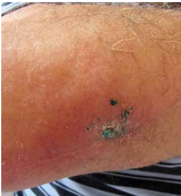
Obr. 2. Lividně-erytémové zbarvení a hmatná podkožní indurace v oblasti při pravém lokti, po probatorní excizi

vat externa s nesteroidními antiflogistiky, vyvazovat končetinu elastickým kompresivním obinadlem a celkově užívat aceklofenak. Potíže se stupňovaly poslední 4 měsíce. Kromě edému, který mu částečně bránil v hybnosti, pociťoval i bolest a tlak v celé pravé horní končetině. Při vstupním kožním vyšetření byla viditelná velmi výrazná asymetrie ve prospěch PHK, na paži + 4 cm, na předloktí + 1,5 cm a zápěstí + 2 cm v obvodu, současně edém všech prstů pravé ruky. Končetina měla erytémové a místy lividní zbarvení, palpačně byla hmatná indurace na dorzu ruky a v okolí jizvy u loktu po výkonu, která nebyla teplejší než okolí (obr. 1, 2). Za hospitalizace byla provedena základní laboratorní vyšetření a RTG plic – bez patologických nálezů. Vyšetření antiboreliových protilátek metodou ELISA bylo vysoce pozitivní ve třídě IgG – 11,240 (referenční meze: pod 0,9 negativní, 0,9–1,1 hraniční, nad 1,1 pozitivní) a negativní ve třídě IgM. Z indurace v blízkosti loktu