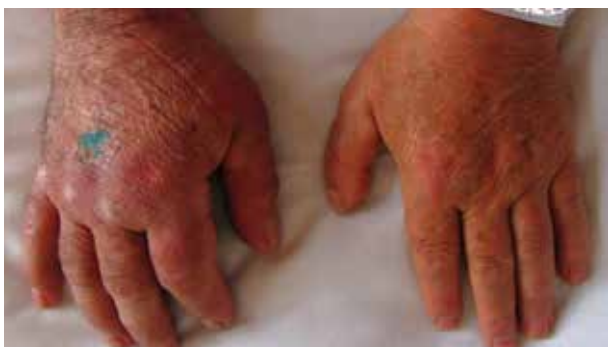
Obr. 1. Stranová diference horních končetin – otok a lividně-erytémové změny PHK, hojící se rána po probatorní excizi na dorzu ruky