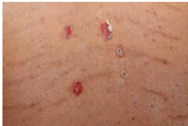
Obr. 2. Erodované projevy na zádech, steroidní akné a počínající strie, listopad 2015

Vzhledem k opakovaným recidivám byla zvolena adjuvantní terapie cyklofosfamidem v pulzním podání následovaná perorální formou léčby. Před zahájením této terapie byla vzhledem k věku pacienta a hrozícím