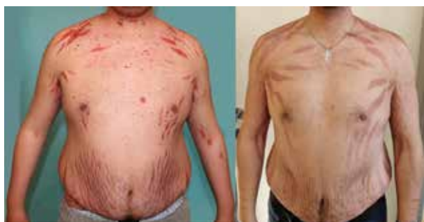
Obr. 4. Cushingoidní syndrom a mohutné striae indukované dlouhodobě podávanými kortikoidy, duben 2016 a při srovnání v listopadu 2018 po léčbě rituximabem

měsíců od zahájení terapie rituximabem, červenec 2017), bez terapie kortikosteroidy, jen s podpůrnou terapií osteoporózy (kalcium 500 mg/den a vitamínem D 400 IU/den, vitamín D 15 kapek 3krát týdně a bisfosfonáty – risedronát 35 mg 1krát týdně). Poslední dávka rituximabu byla podána před 17 měsíci v říjnu 2018. Pacient nadále dochází na pravidelné kontroly klinického stavu i laboratoře po dvou měsících.