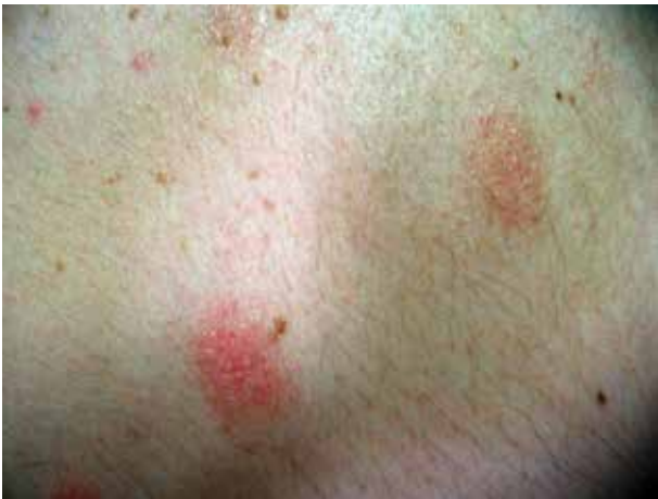
Obr. 2. Detail ložiska mucinosis follicularis

Závěr: folikulární mucinóza benigní subakutní formy, kdy přesvědčivé známky folikulotropní mycosis fungoides nejsou přítomny. Bylo doplněno podrobné laboratorní vyšetření. Kompletní biochemické vyšetření krve, C-reaktivní protein, hormony štítné žlázy, onkologické markery (CA 19-9, CEA, PSA, beta-2-mikroglobulin, alfa-1-fetoprotein) a antiborreliové protilátky byly negativní.