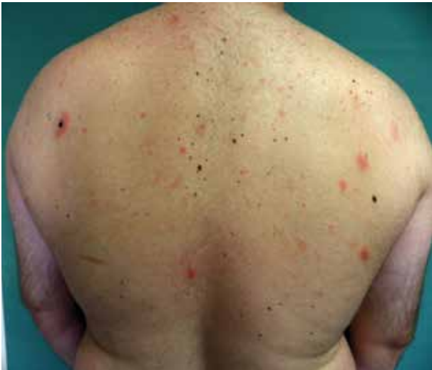
Obr. 1. Mucinosis follicularis