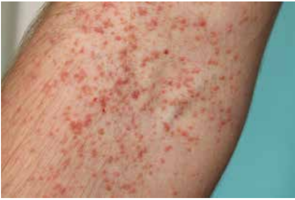
Obr. 3. Detail jednotlivých morf v kubitě

ginózně tvoří exofytické vegetující léze. Jizvám po předchozích operačních výkonech se výsev zpravidla vyhýbá. Postižení kompletně celého kožního krytu je extrémně vzácné. Ve vzácných případech může být Darierova choroba limitována pouze na specifickou kožní lokalitu, např. bradavky [35] či vulva.