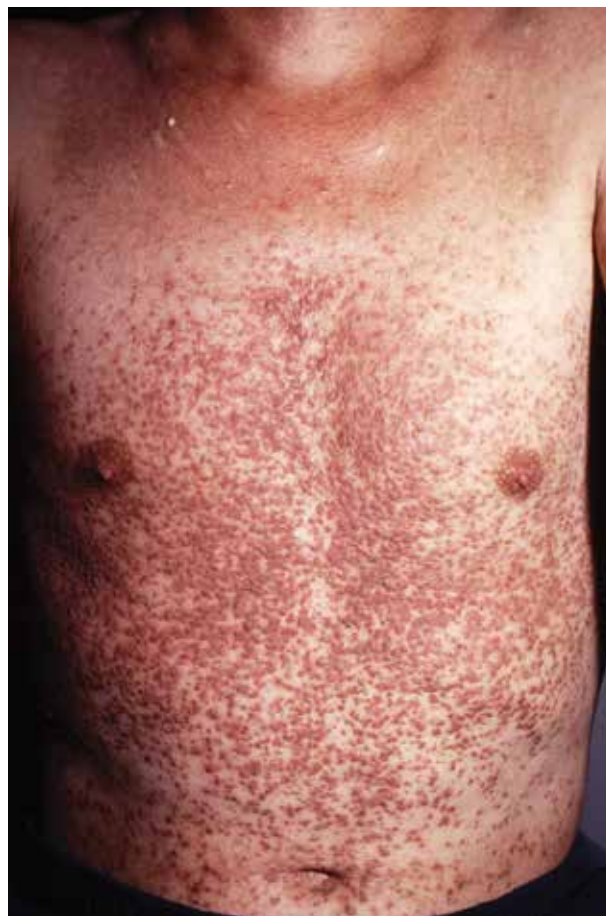
Obr. 1 a 2. Typický klinický obraz na trupu s výsevem nesčetných hyperkeratotických papul často splývajících v plochy

Často jsou postiženy axily, třísla, okolí anu a submamární oblast u žen, kde mají ložiska vyšší tendenci k mokvání a bakteriální kolonizaci. Ojedinele se především intertri-