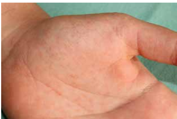
Obr. 4. Typický výsev drobných punktátních keratóz na kůži dlane

Charakteristické je postižení dlaní a plosek , které se vyskytuje až u 96 % nemocných. Na kůži tlustého typu rukou a nohou se tvoří punktátní keratózy ve formě mnohočetných jamek či papulek, které mohou přerušovat papilární linie (obr. 4). Tíže postižení dlaní převažuje nad postižením plosek. Vzácněji vznikají ostře ohraničená silná ložiska keratodermie v centrální části dlaní, na ploskách v místech nejvyšší tlaku s případným vznikem fisur [88]. V několika případech byl zaznamenán výskyt palmoplantárního postižení ve formě mnohočetných hyperortokeratotických filiformních („spiny“) hy-