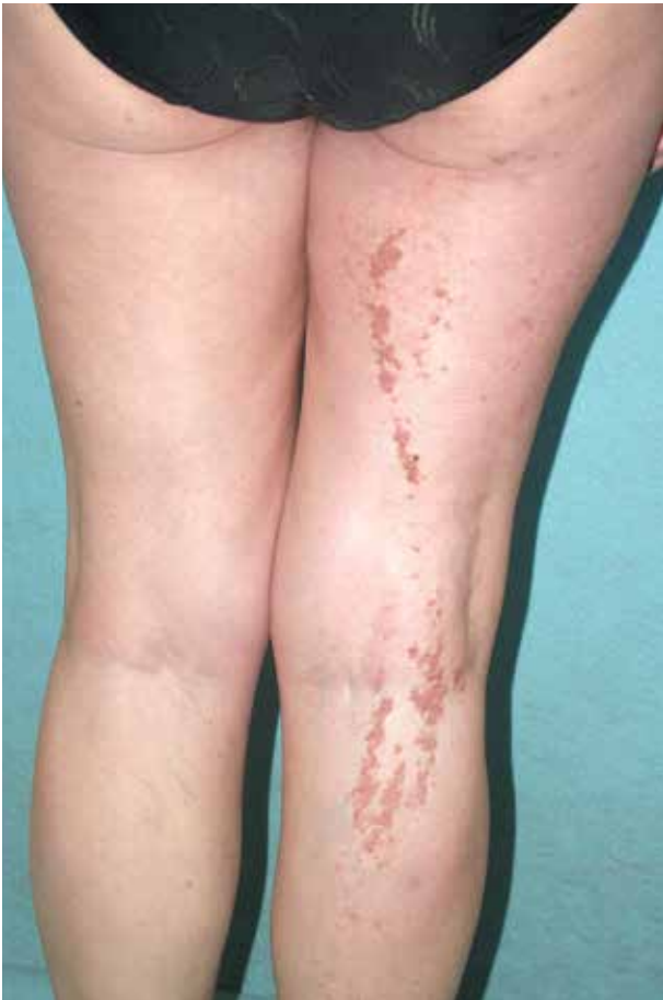
Obr. 6. Klinický obraz segmentálního postižení 1. typu

známy ze studií pigmentových onemocnění. Vzhledem k absenci ustáleného českého ekvivalentu jsou dále též uvedeny anglické originální názvy: