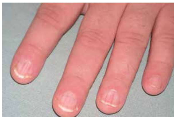
Obr. 5. Typické postižení nehtů rukou s podélnou erythro/leuconychií

Hlášen byl případ vzniku subunguálního spinocelulárního karcinomu s průkazem přítomnosti HPV typu 16 [30].