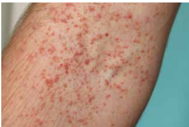
Obr. 3. Detail jednotlivých morf v kubitě

ginózně tvoří exofytické vegetující léze. Jizvám po předchozích operačních výkonech se výsev zpravidla vyhýbá. Postižení kompletně celého kožního krytu je extrémně vzácné. Ve vzácných případech může být Darierova choroba limitována pouze na specifickou kožní lokalitu, např. bradavky [35] či vulva.