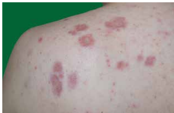
Obr. 2. Noduly v detailu

U pacienta byla proto zahájena kombinovaná systémová terapie prednisonem v dávce 20 mg denně a metotrexátem v dávce 10 mg 1krát týdně. Vzhledem k dobré terapeutické odezvě a pozvolné regresi plicního nálezu byla dávka prednisonu postupně snižována na současných 5 mg denně, dávka metotrexátu prozatím ponechána na 10 mg 1krát týdně. Pacient zůstává nadále v pravidelné pneumologické péči. Při poslední kontrole, 32 měsíců po zahájení léčby, byl pacient bez kožních projevů, plicní nález byl oboustranně s výraznou regresí postižení intersticia.