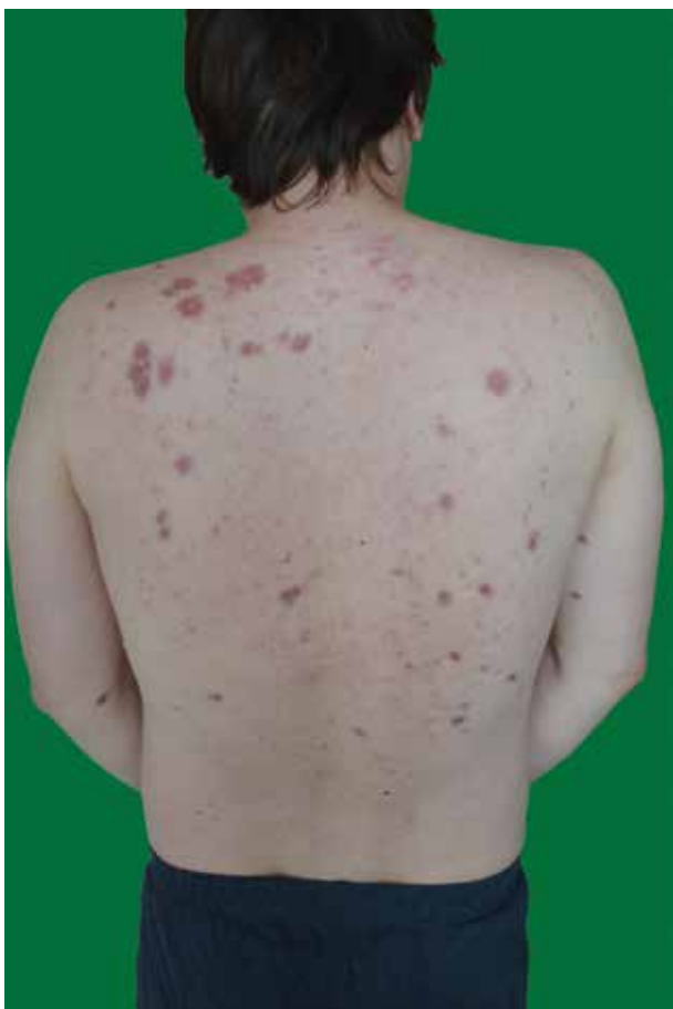
Obr. 1. Mnohočetné uzlovité infiltráty hnědočerveného zbarvení

V květnu 2016 byla cestou pneumologa zahájena systémová kortikoterapie prednisonem v úvodní dávce 40 mg/den s postupnou redukcí dávky při regresi plicního i kožního nálezu. Specifické laboratorní markery klesly do mezí normy. Spirometrické vyšetření prokázalo výrazné zlepšení funkčních hodnot. V srpnu 2017 se podařilo navodit remisi onemocnění a systémová kortikosteroidní léčba byla ukončena. Při kontrolním plicním vyšetření v dubnu 2018 se však laboratorně opětovně objevila výrazná elevace výše uvedených specifických markerů a zhoršení hodnot spirometrického vyšetření. Na rentgenovém snímku hrudníku bylo patrné zvětšení obou plicních hilů. Stejně tak byla potvrzena progresse nálezu CT vyšetřením. Stav byl hodnocen jako první recidiva plicní sarkoidózy. Recidiva kožního postižení se neopakovala.