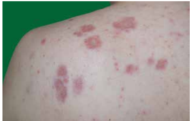
Obr. 3. HE 100krát – nekaseifikující dobře ohraničené „nahé“ sarkoidní granulomy v dermis a subcutis Fotografie publikována se souhlasem Ústavu klinické a molekulární patologie FN Olomouc.