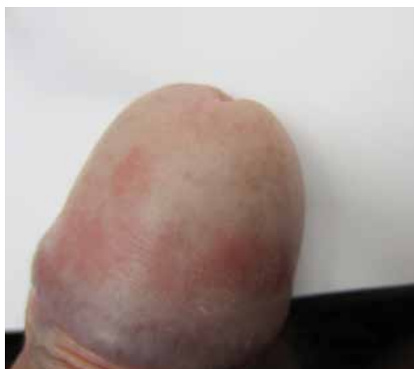
Obr 6. Atopická ekzém/dermatitida