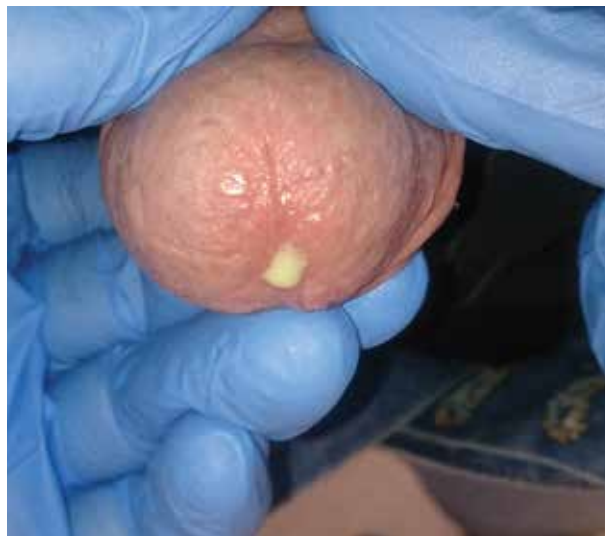
Obr. 2. Kapavčitá uretritida