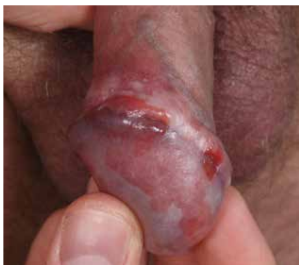
Obr. 9. Erythroplasia Queyrat