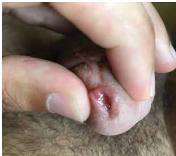
Obr. 8. Akuminátní kondylom ústí močové trubice