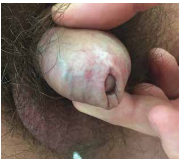
Obr. 5. Lichen sclerosus