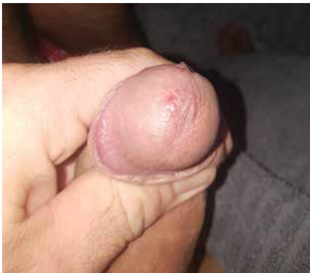
Obr. 1. Ulcus durum