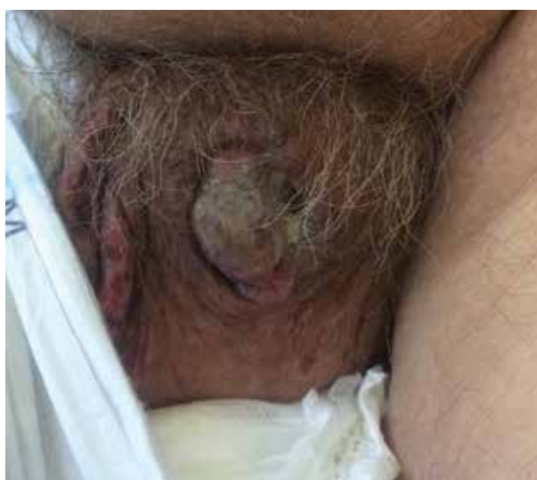
Obr. 10. Invazivní spinocelulární karcinom