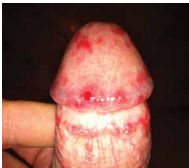
Obr. 4. Herpes genitalis