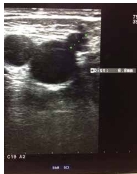
Obr. 4. Dopplerovská ultrasonografie vena saphena magna