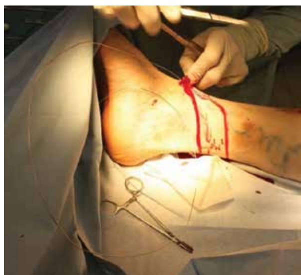
Obr. 6. Zavádění endostriptomu

Nejčastější komplikací je porušení senzitivní inervace – nervus saphenus (obvykle reverzibilní) a krvácení. Další nevýhodou je delší rekonvalescence. Mezi závažnější komplikace chirurgické intervence patří HŽT, plicní embolie (zřídka), tromboflebitida [19, 33, 51]. Výkon je prováděn v celkové, či svodné anestezii. Exstirpace se provádí speciálním nástrojem – endostriptomem (obr. 6). Snaha o limitovaný stripping z důvodu zachování žíly k revaskula-