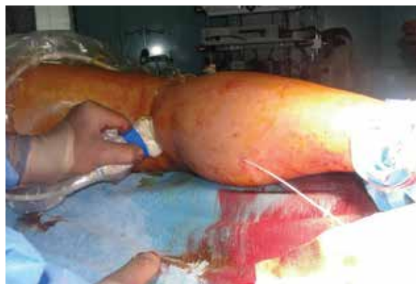
Obr. 8. Zavádění vlákna do vena saphena parva pod ultrazvukovou kontrolou

Laserové vlákno je zavedeno do žíly pod USG kontrolou precizně 1–2 cm od safenofemorální junkce. Následně lze pacienta uvést do Trendelenburgerovy polohy za