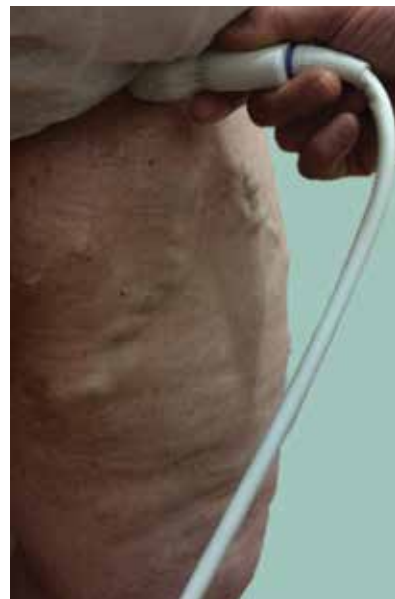
Obr. 3. Dopplerovská ultrasonografie vena saphena magna

Po zhodnocení lokálního nálezu odesíláme nemocného při potřebě k vyšetření duplexní sonografií. Sonografie je v diagnostických metodách nyní na prvním místě, jelikož invazivní flebografie se v podstatě neprovádí s výjimkou některých komplexních vaskulárních malformací. Dopplerovská ultrasonografie (obr. 3, 4) je hlavní a nedílnou součástí flebologické diagnostiky,