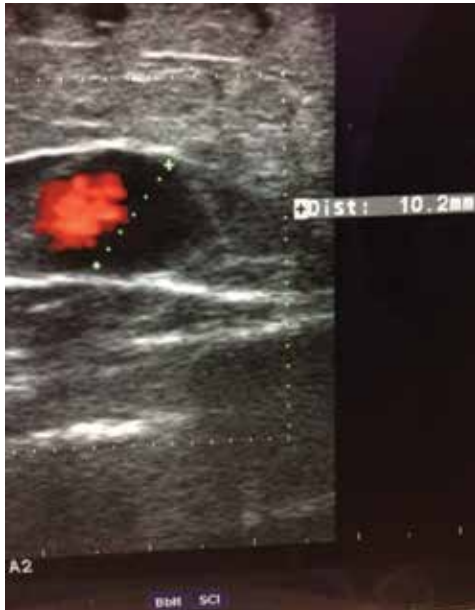
Obr. 5. Dopplerovská ultrasonografie vena saphena magna – Valsalvův fenomén a diametr žíly

zobrazí požadovanou část žilního řečiště na základě odrazu ultrazvukových vln na proudících erythrocytech, pomocí tohoto jevu diagnostikujeme patologický reflux krevního proudu v požadovaném žilním úseku. Čím větší je reflux (obr. 5) tím je CVI horší [23, 37,49].