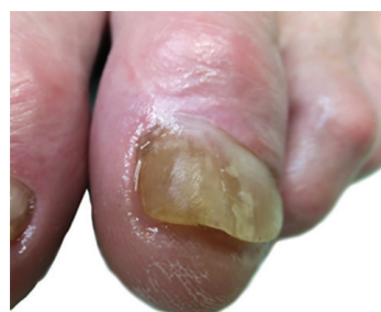
Obr. 4b. Nehty dolní končetiny při kontrole po šesti měsících od první aplikace NTP. Proximálně je po celé bázi patrná odrůstající zdravá nehtová ploténka v délce cca 5–6 mm. Nehet má v distální části rovné okraje bez hyperkeratóz. Mediální hrana nehtu je elevována korekcí zarůstajícího nehtu a shora fixována speciálním akrylem.