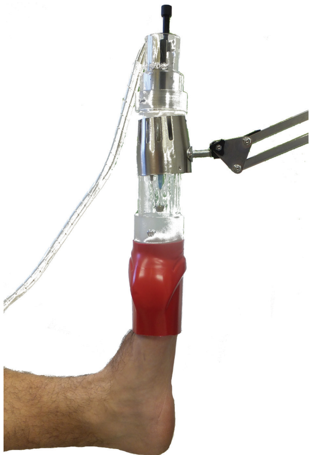
Obr. 2. Fotografie přístroje při expozici postižené končetiny nízkoteplotním plazmatem Zdroj plazmatu, schematicky znázorněný na obrázku 1, je uzavřen v plexisklovém pouzdře a upevněn v teleskopickém držáku. Prsty exponované nohy jsou uzavřeny v plastovém obalu.

benhamiae ) a Nannizzia gypsea byl kompletně inaktivován jen jeden ze tří testovaných kmenů. Podrobněji uvádějí výsledky těchto in vitro studií Soušková et al. [23, 25] a Scholtz et al. [18].