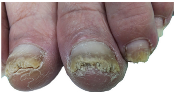
Obr. 3a. Palce obou dolních končetin před aplikací NTP: hyperkeratóza distálních částí nehtových plotének s drolením, zdravá proximální část ploténky cca 3–4 mm. Nehtové ploténky ostatních prstů distálně rovněž postiženy onychomykózou v různém rozsahu.

V říjnu 2016 bylo mikroskopické vyšetření vzorku nehtů pozitivní na dermatofytická vlákna, kultivačně byl identifikován původce T. interdigitale .