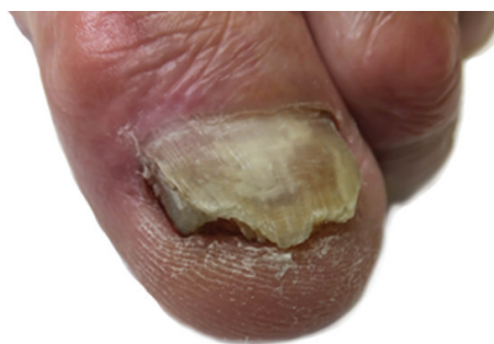
Obr. 4a. Nehty dolní končetiny před aplikací NTP: postižení nehtové ploténky v celém rozsahu, volný okraj nehtu nerovný, se známkami hyperkeratózy a drolení, na mediální straně nehtové ploténky se vyskytují známky rozštěpu a zarůstání.