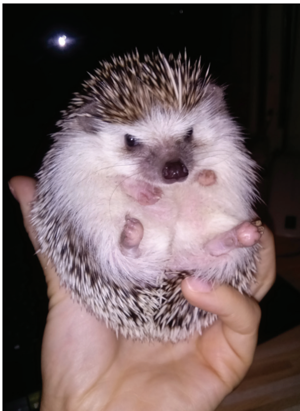
Obr. 4. Ježek bělobřichý ( Atelerix albiventris ) chovaný pacientkou 4