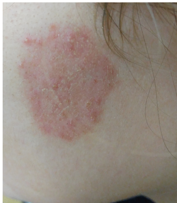
Obr. 1. Tinea faciei vyvolaná Trichophyton erinacei u pacientky 1 – oploštělé ložisko po devíti dnech lokální terapie ciklopiroxolaminem

Pacientka (žena, 19 let) se poprvé dostavila k lékaři dne 22. 12. 2016 s kožním ložiskem nacházejícím se