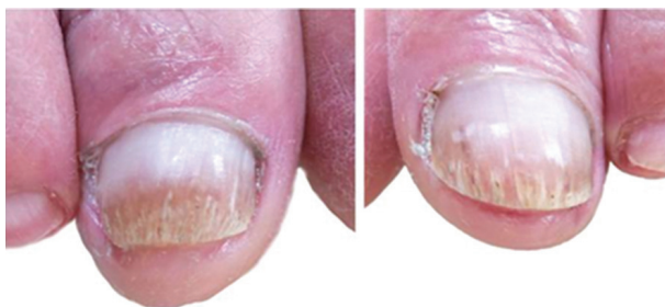
Obr. 3b. Nehtové ploténky palců obou dolních končetin po sedmi měsících od první aplikace NTP: bez hyperkeratóz na distálních stranách, odrůst nehtové ploténky do půl až dvou třetin délky. Ostatní nehty bez mykotických změn.