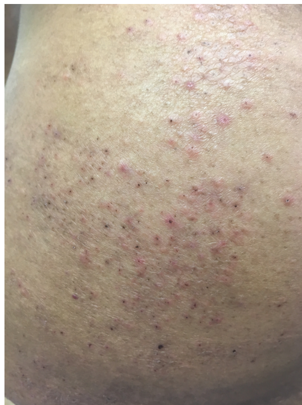
Obr. 1a, b. Výsev převážně na hýždích a dolních končetinách

Imunopatogeneze tohoto onemocnění je nadále tématem diskusí. Část autorů se domnívá, že v úvodu dochází k reakci typu Arthusovu fenoménu se vznikem imuno-komplexů a jejich depozity ve stěně malých cév. Aktivací komplementu dochází ke zpuštění leukocytoklastické vaskulitidy vedoucí k destrukci cévní stěny a nekróze