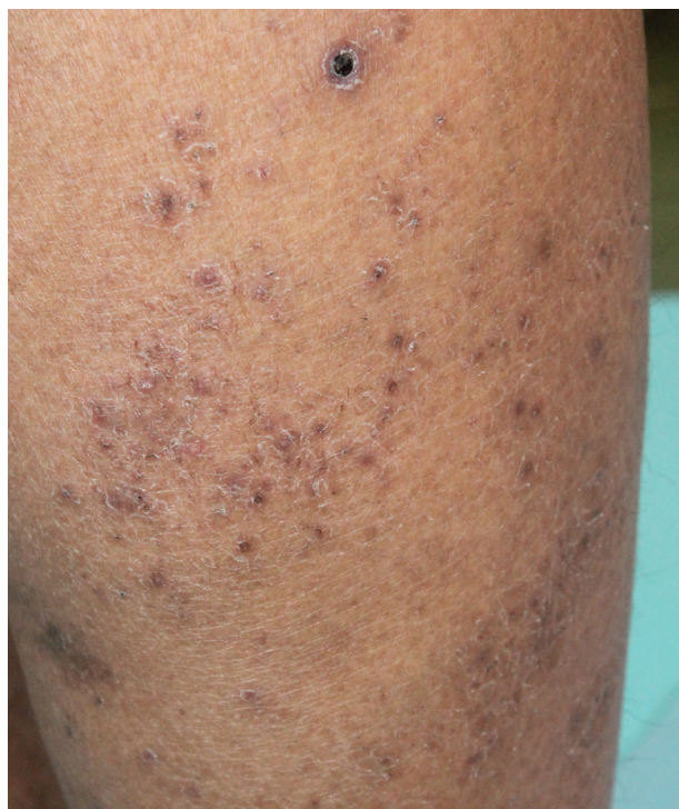
Obr. 2. Papuly, místy s centrální nekrózou na lýtku

tkání. Následně je imunopatologická reakce typu III u pacientů se silnou imunitou nahrazena reakcí buněčného pozdního typu IV se vznikem klasického granulomatózního zánětu. Část autorů s touto teorií nesouhlasí, histologicky se často postrádají známky leukocytoklastické vaskulitidy a vznik primárních lézí považují za následek subakutní lymfohistiocytární vaskulitidy, která vede ke vzniku drobných mikrotrombů s ischemickou nekrózou tkáně [22].