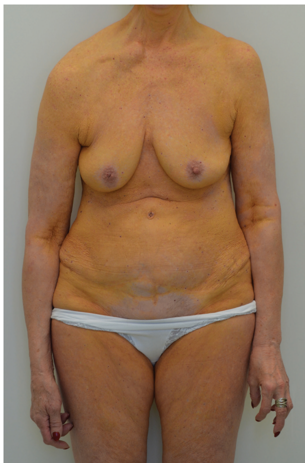
Obr. 1. Žlutooranžové zbarvení přední strany trupu a končetin (oblast areol a podbřišku bez postižení), luxace pravé klavikuly

Pacientka byla odeslána k novému přešetření na hematologii a po konzultaci s hematologem byla pro výraznou progresi kožního nálezu a symptomatický mnohočetný myelom zahájena protinádorová terapie. Od