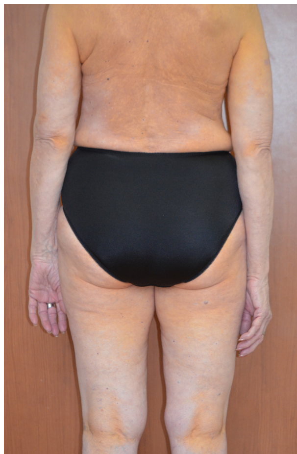
Obr. 2. Postižení v podkolenních jamkách